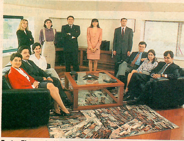
Factor Ekspres kadrosu toplu halde görülüyor.

geçişte gösterdikleri hızlığı, müşterilerine verecekleri hizmette de sürdüreceklerini belirtiyor. "Kaliteli servis ilkesiyle factoring hizmetini, maksimum müşteri tatminini hedefleyen, çağdaş anlayış ve değerlerle